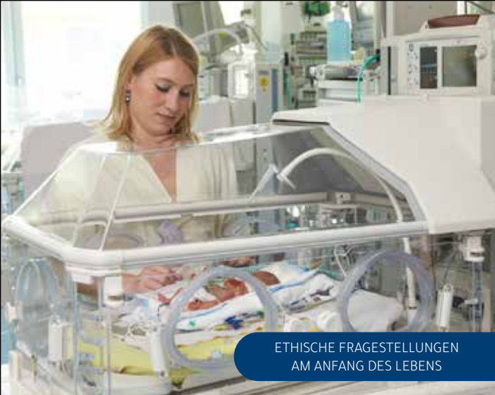
ETHISCHE FRAGESTELLUNGEN AM ANFANG DES LEBENS