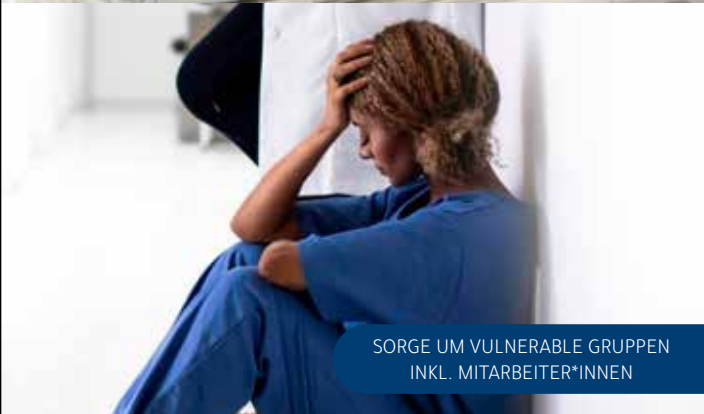
SORGE UM VULNERABLE GRUPPEN INKL. MITARBEITER*INNEN